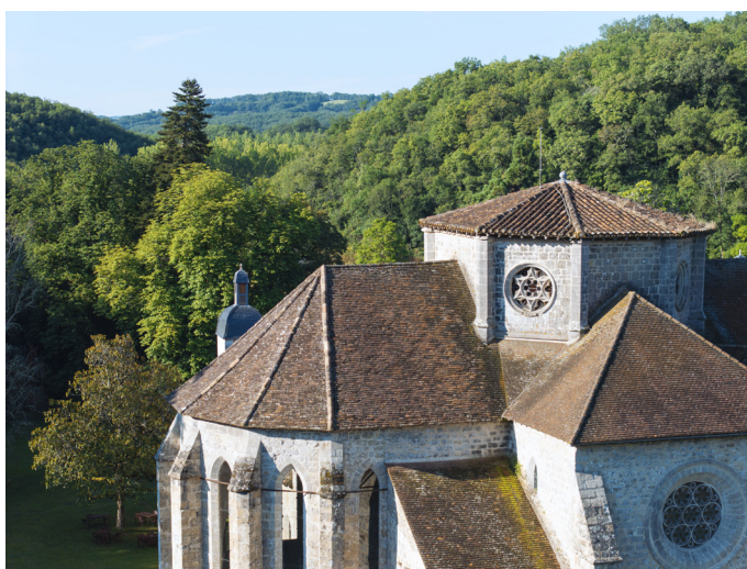
Abbaye de Beaulieu-en-Rouergue, chevet de l'abbatiale, vue aérienne