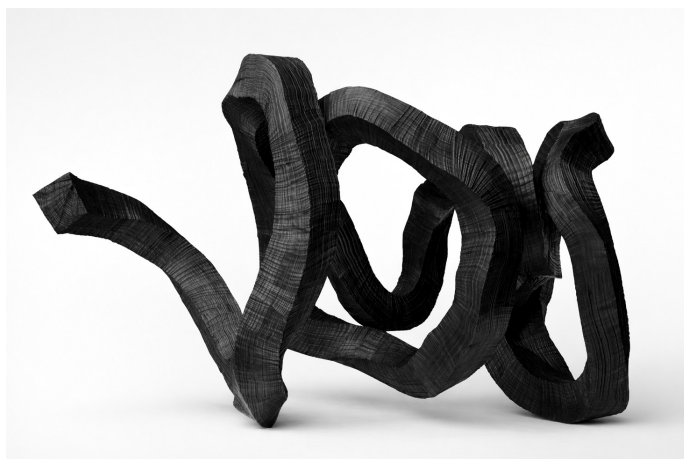
Brushstroke JV3, 2026, Bronze