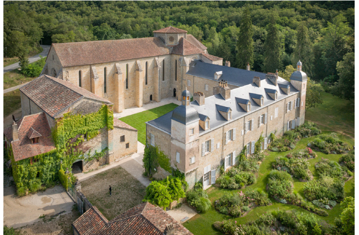
Abbaye Notre-Dame de Beaulieu-en-Rouergue côté sud, vue aérienne © Marc Allenbach / Centre des monuments nationaux

Fondée au milieu du XIIe siècle, probablement par des moines ermites, puis rattachée à l'ordre Cistercien en 1197, l'abbaye de Beaulieu-en-Rouergue a rouvert ses portes à l'été 2022, après 18 mois de travaux. Elle propose un nouveau parcours muséal permanent au sein du logis abbatial, poursuivant l'œuvre de Pierre Brache et Geneviève Bonnefoi, mécènes et collectionneurs. Près de 200 œuvres d'art contemporain dialoguent avec l'architecture cistercienne, dans l'écrin de verdure d'un parc paysager et d'un jardin planté de mille roses.