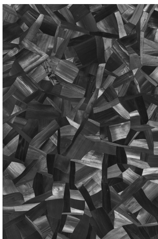
Issu du feu al-5, 2003, Charcoal on canvas © Courtesy of the artist and Perrotin