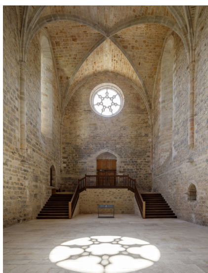
Abbaye de Beaulieu-en-Rouergue, nef