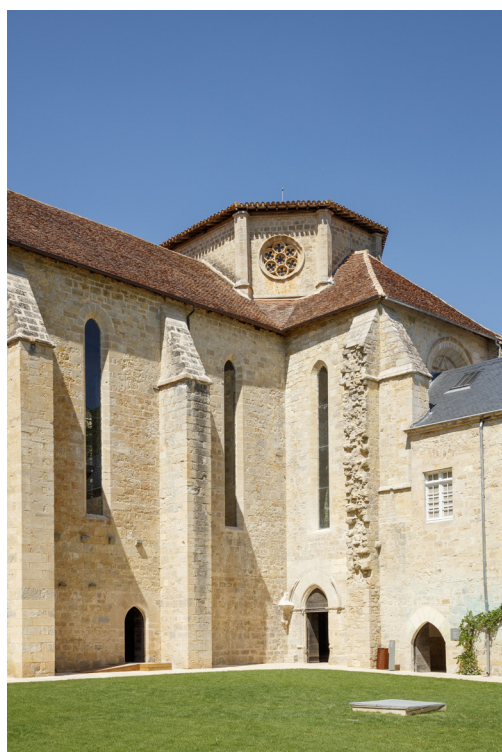
Abbaye Notre-Dame de Beaulieu-en-Rouergue, église abbatiale depuis le cloître

En Attendant dévoile un ensemble d'œuvres dont la diversité et délicatesse de formes (œuvres graphiques, installations, sculptures) vibrent avec les espaces d'exception de l'abbaye et en prolongent et élargissent la contemplation.