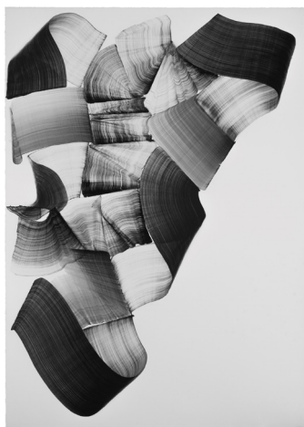
Brushstroke-Ar5, 2026, Charcoal ink on paper