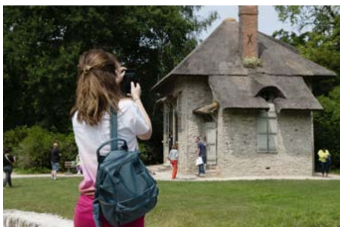
Domaine national de Rambouillet, visiteurs

En se connectant sur www.mapierrealedifice.fr , les amoureux du patrimoine peuvent faire un don pour le château de Rambouillet (« Mon monument préféré ») et ainsi contribuer à l'animer, l'entretenir et le préserver.