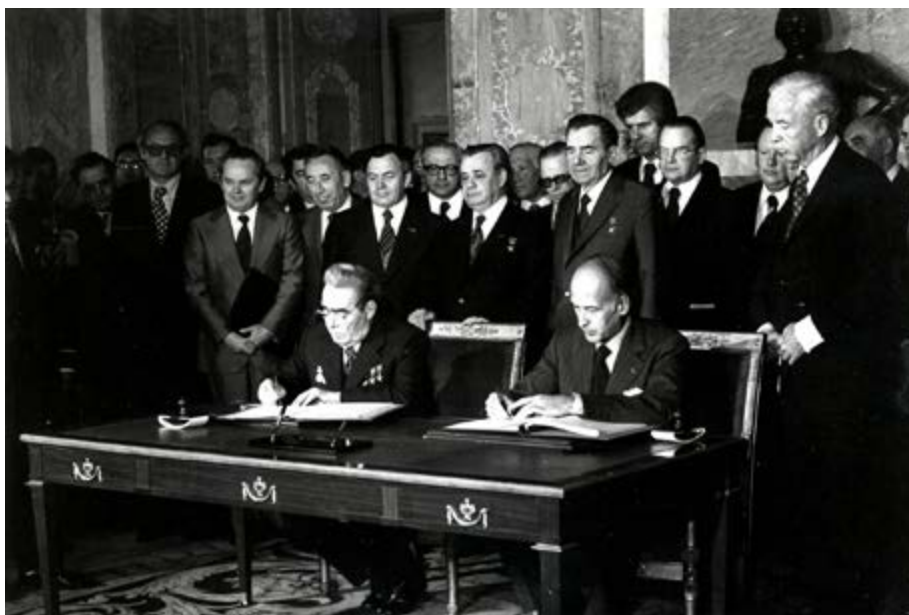
Voyage officiel de Leonid Brejnev en France, signature des accords Franco-Russes à Rambouillet 20-22 juin 1977 Ministère de l'Europe et des Affaires étrangères, Centre des Archives diplomatiques de La Courneuve, Collection iconographique, A019746 © Ministère des Affaires étrangères