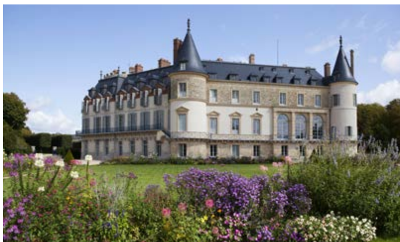
Château de Rambouillet, façade sur le jardin et façade sur le grand canal

Rambouillet est l'exemple unique d'un château qui a connu à la fois l'Ancien Régime, l'Empire et la République. Situé à proximité de Versailles, et à une cinquantaine de kilomètres de Paris, il offre un refuge parfait pour goûter un peu de quiétude à côté des coeurs battants du pouvoir. A cela s'ajoute la présence de l'une des plus belles forêts d'Île-de-France, réputée pour la qualité de ses chasses. Véritable havre de paix, le lieu est donc idéal pour combiner vie de famille et rencontres diplomatiques de haut vol, dans un style décontracté. De quoi attirer ici les plus grandes figures de notre Histoire telles que Louis XVI, Napoléon I er , ou encore Charles de Gaulle.