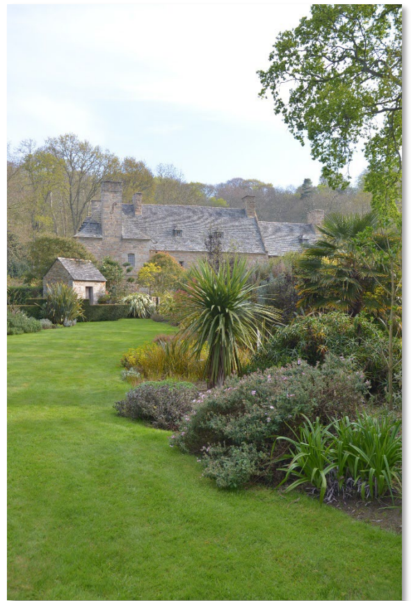
Penvénan Jardin de Pelline