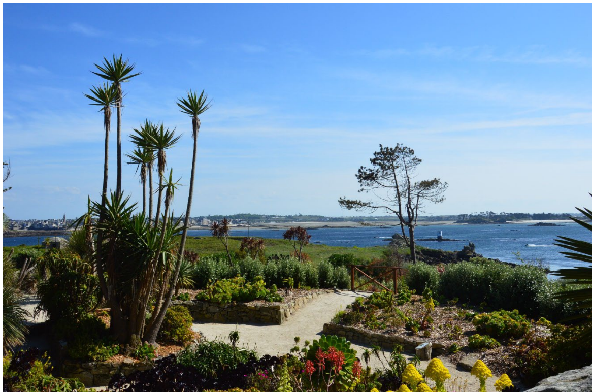
Île-de-Batz Jardin Georges Delaselle