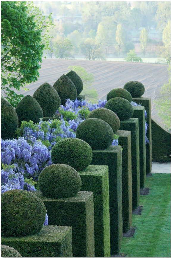
Bazouges-la-Pérouse Jardins du château de la Ballue