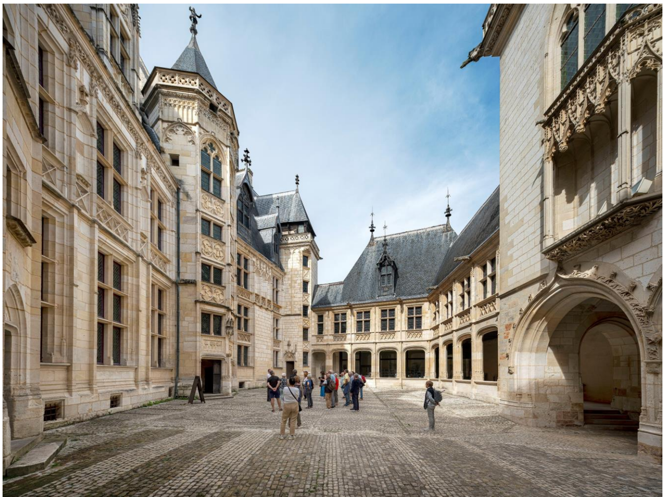
Palais Jacques-Coeur, visiteurs dans la cour d'honneur