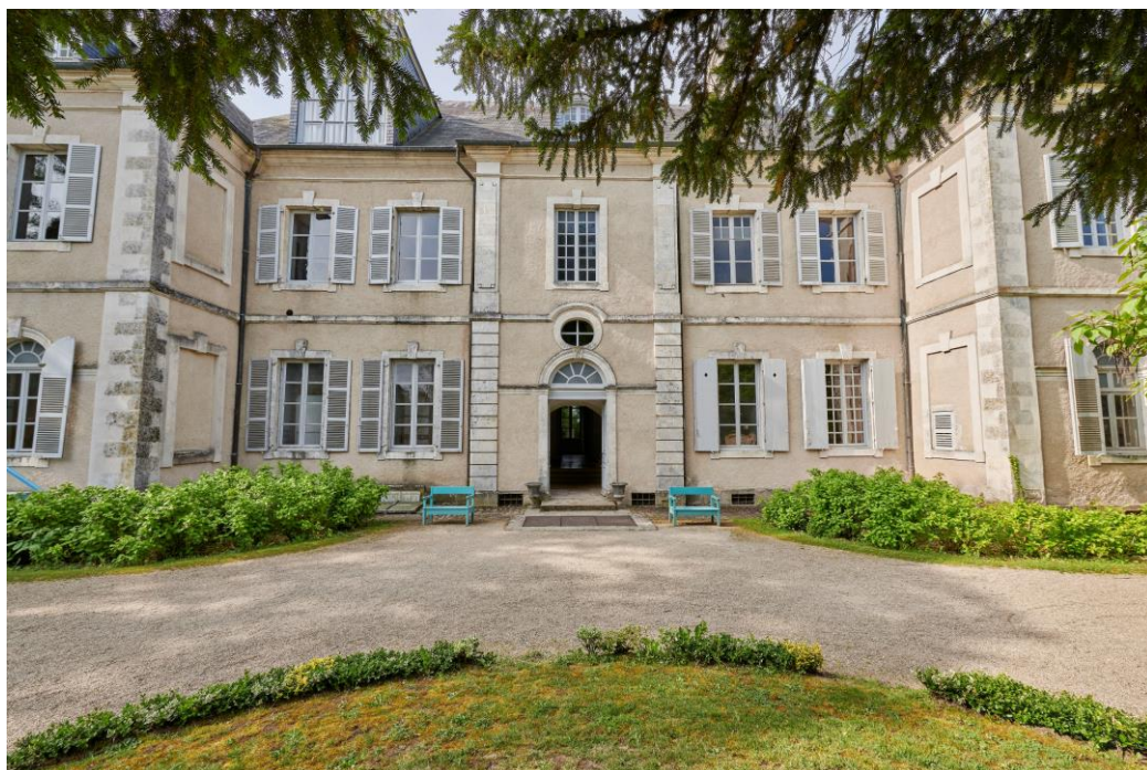
Maison de George Sand à Nohant

Posée « au bord de la place champêtre sans plus de faste qu'une habitation villageoise » : ainsi George Sand évoque-t-elle sa demeure de Nohant, située au fond d'une cour entourée de dépendances. Construit à la fin du XVIII e siècle pour le gouverneur de Vierzon, ce petit château fut acquis en 1793 par Mme Dupin de Francueil, grand-mère de George Sand, qui l'entoura d'un vaste parc. C'est dans ce cadre que se déroulèrent l'enfance et l'adolescence de la petite Aurore Dupin. Devenue plus tard une auteure majeure du XIX e siècle, elle y écrivit la majeure partie de son œuvre et y reçut nombre d'hôtes illustres : Liszt et Marie d'Agoult, Balzac, Chopin, Flaubert, Delacroix qui y eut son atelier... L'intérieur de la maison a conservé le décor que l'écrivain connut jusqu'à sa mort : salle à manger, chambre bleue, petit théâtre et théâtre de marionnettes.