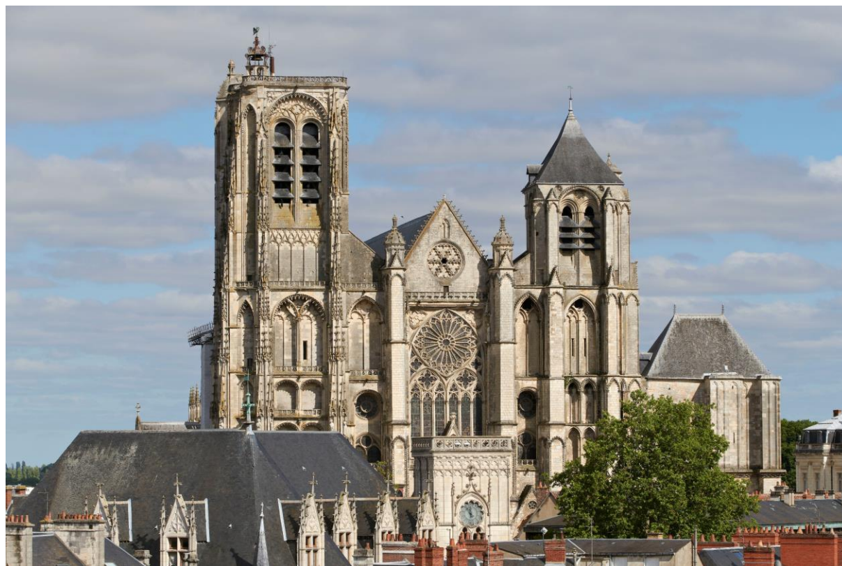
Cathédrale Saint-Étienne de Bourges vue depuis le palais Jacques-Coeur

La cathédrale est un chef-d'œuvre du gothique qui illustre une période importante de l'histoire. A ce titre, elle est classée sur la liste du patrimoine mondial de l'UNESCO en 1992, « Cathédrale de Bourges », puis comme composante des chemins de Compostelle en France en 1998, « Chemins de Saint-Jacques-de-Compostelle : Camino francés et chemins du nord de l'Espagne ».