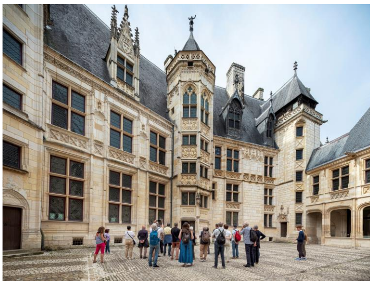
Palais Jacques Cœur, visiteurs dans la cour d'honneur

De 1443 à 1451, date de son arrestation, Jacques Cœur, grand marchand et financier français du XV e siècle fait construire à Bourges, point fixe de ses pérégrinations, un palais qu'il n'habitera pas. Œuvre d'un architecte inconnu, le palais Jacques Cœur est l'un des plus beaux édifices que nous ait laissés l'architecture civile gothique arrivée à sa dernière période, déjà marquée par la grâce et la fantaisie de la Renaissance française. Le palais s'ouvre sur la place Jacques Cœur par un pavillon d'entrée percé d'une grande porte et d'une poterne. Sur cette façade, comme sur toutes les autres parties de l'édifice, apparaissent les armes parlantes de Jacques Cœur : la coquille Saint-Jacques et le cœur, ainsi que sa célèbre devise « A vaillans cuers riens impossible ».