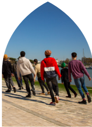
Mille Plateaux, CCN La Rochelle © Jocelyn Cottencin A Sentimental Landscape © Virginie Meigne 20 danseurs pour le XXe siècle © Caroline Lessire