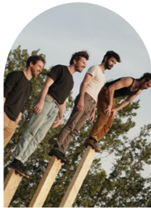
Clan Cabane © Théo Lavanant g r o o v e © Sandy Korzekwa