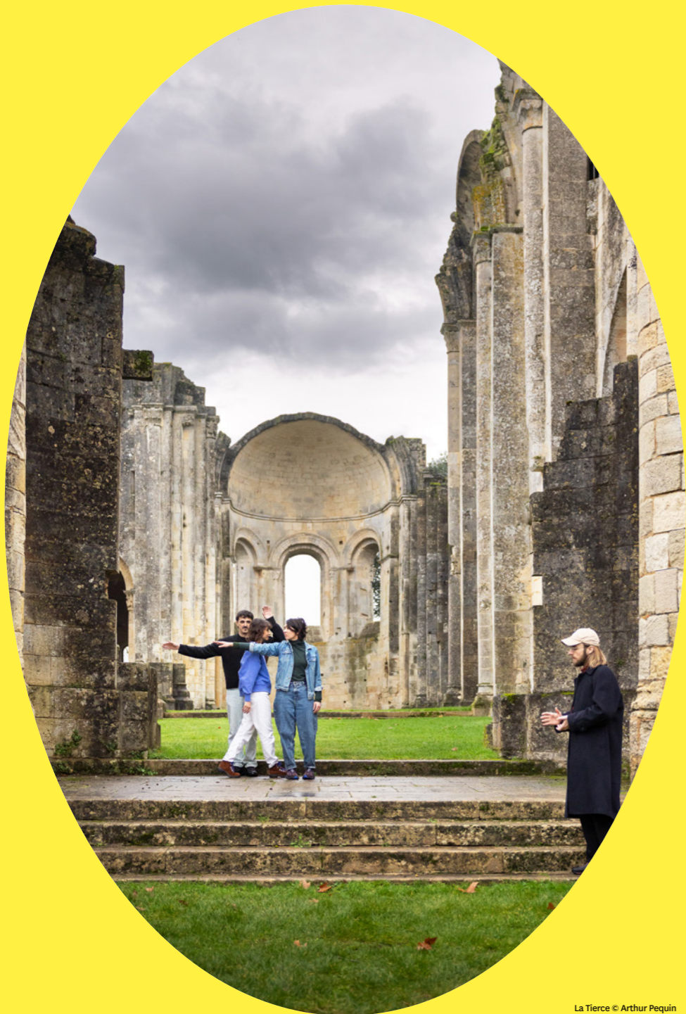
La Tierce