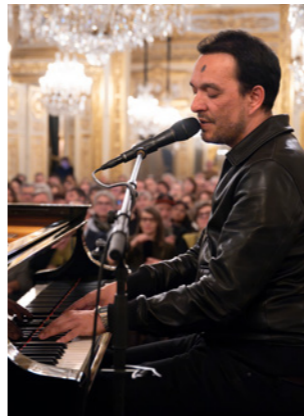
Malik Djoudi invite Gaspar Claus Fantasie Minor