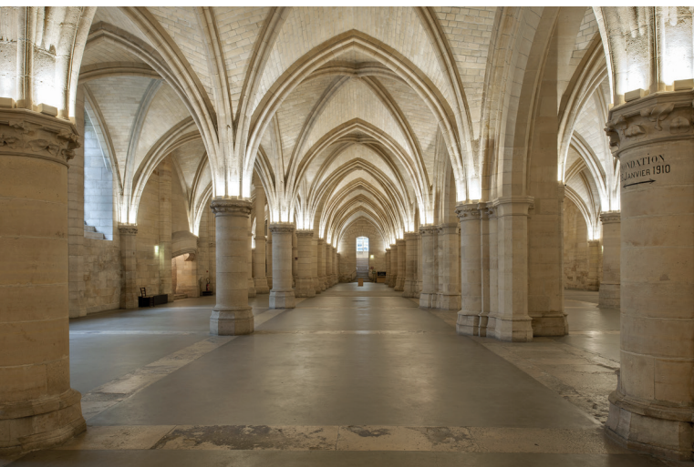
Conciergerie -salle des Gens d'armes