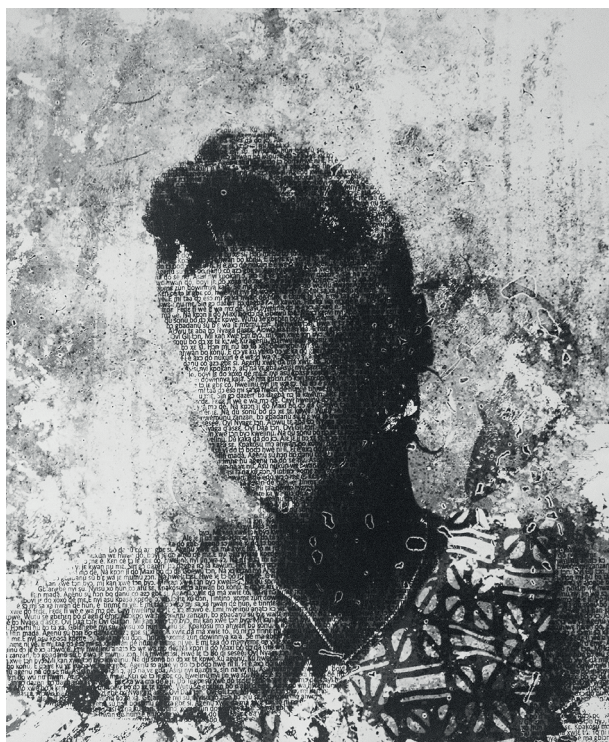
Sènamì Donoumassou, Xogbe – série ako mla mla- Agenùvì hwelinù, Collection nationale du Bénin, 61 x 50,8 cm, 2022