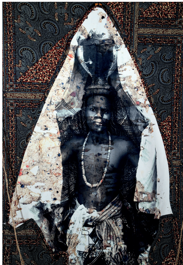
Louis Oké-Agbo, Voile de reconnaissance, Collection particulière, 146 x 197 cm, 2024, photo © Louis Oké-Agbo, (détail de l'oeuvre)