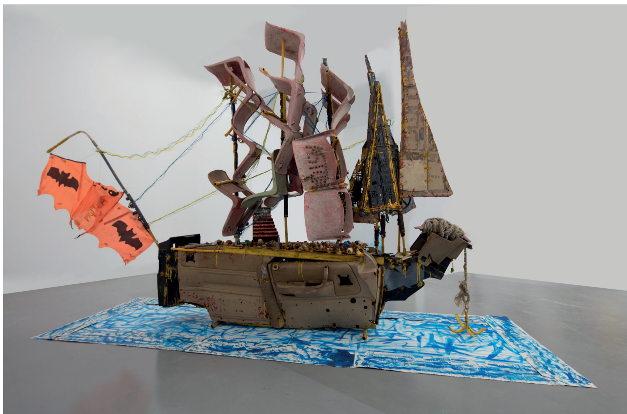
Aston, Le voilier du temps, Collection Galerie Vallois, 260x280x65cm, 2016, photo © Charles Placide

Après l'installation de l'ensemble sculpté « La Bataille de Little Bighorn » d'Ousmane Sow à la Place forte de Mont-Dauphin, pour une durée de dix ans, et la carte blanche confiée à l'artiste ghanéen El Anatsui à la Conciergerie en 2021, le Centre des monuments nationaux présente ici un troisième projet dédié à la création contemporaine africaine.