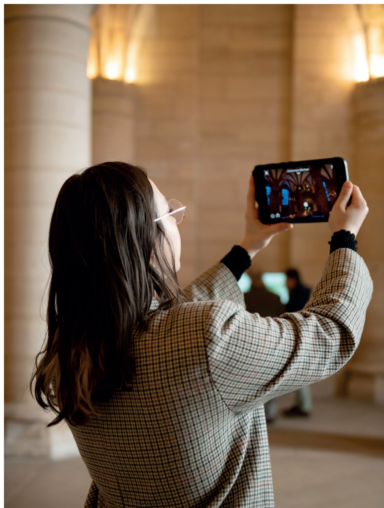
Conciergerie, l'HistoPad