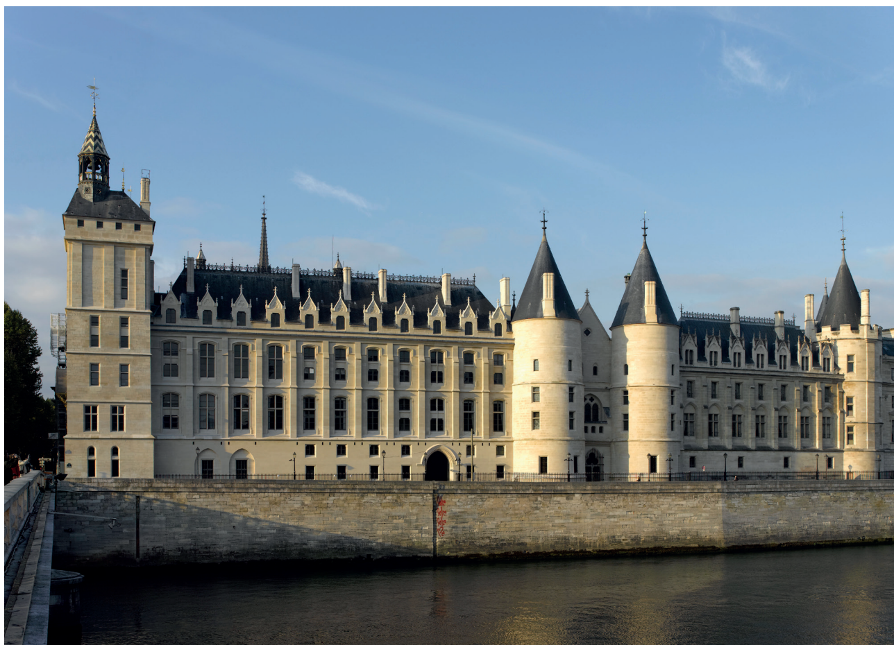
La Conciergerie

En se connectant sur www.mapierrealedifice.fr , les amoureux du patrimoine peuvent faire un don pour la Conciergerie (« Mon monument préféré ») et ainsi contribuer à l'animer, l'entretenir et la préserver.