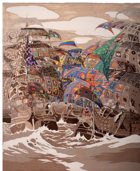
Julien Sinzogan, Le retour des esprits, Collection nationale du Bénin, 220x180cm, 2021