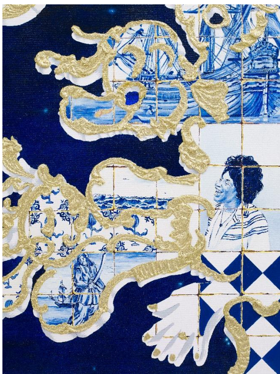
© Alicia Paz, Pirates and Poets (2020)