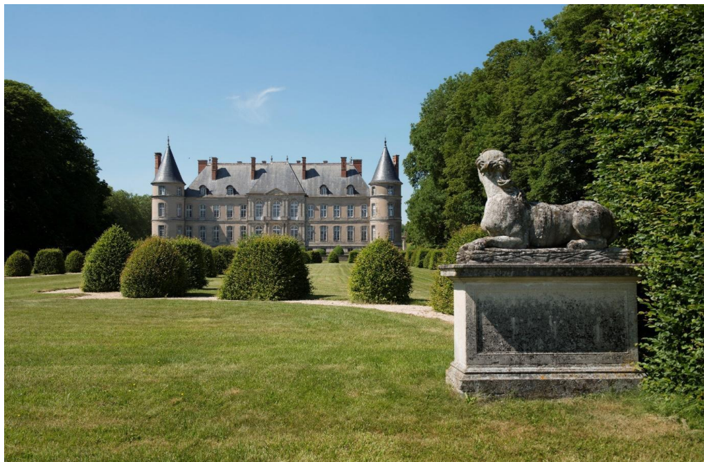
Château de Haroué, façade sud sur jardin

Le prince Marc de Beauvau-Craon prit possession des terres de Haroué en 1720 et fit immédiatement appel à l'architecte Germain Boffrand pour reconstruire le château médiéval réaménagé pour les Bassompierre à la fin du XVI e siècle. Boffrand avait travaillé sur des chantiers royaux avant de se tourner vers des clients privés, parmi lesquels le duc de Lorraine, Léopold 1 er , dont Marc de Beauvau était le grand écuyer. A Haroué, Boffrand conserva les douves du château médiéval et s'adapta à sa structure avec quatre tours cantonnant un corps de logis principal et deux ailes. Les travaux de ce chef-d'œuvre de l'architecture française du XVIII e siècle s'achevèrent en 1729. Les grilles de la cour d'honneur, ainsi que les ferronneries des balcons et de l'escalier d'honneur, ont longtemps été attribuées à Jean Lamour auteur des grilles de la place Stanislas à Nancy. Elles sont en réalité l'œuvre du serrurier Pierre Barthélémy qui s'illustra sur le chantier de Lunéville. Les statues des jardins, dues à Barthélemy Guibal, sont en revanche un point commun indubitable avec la place Stanislas puisque Guibal fut un des principaux auxiliaires de son architecte, Emmanuel Heré.