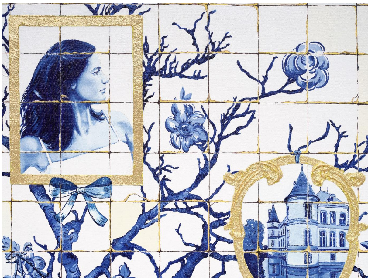
Murmur in the Trees, 2024 (détail)

© Alicia Paz, ADAGP, Paris, 2024