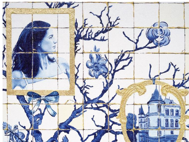
© Alicia Paz, Murmur in the Trees (2024)