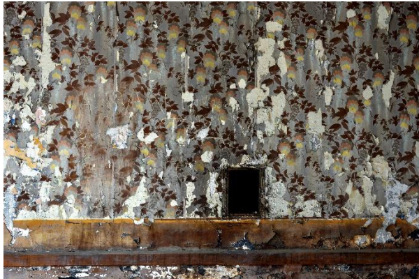
FORT DE TOURNOUX, La Condamine -Châtelard (04)