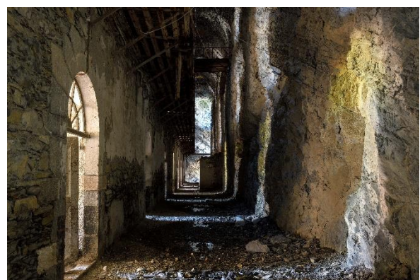
FORT DE TOURNOUX, La Condamine-Châtelard (04)