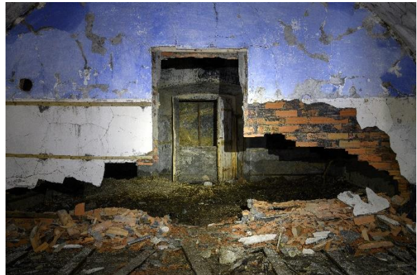
BATTERIE DU CHABERTON, Montgenèvre (05)