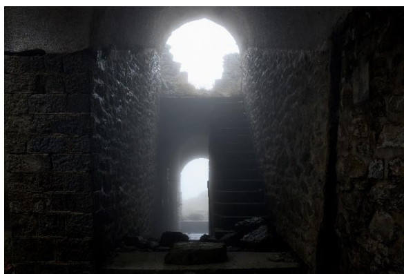
MASSIF DE L'AUTHION, la Bollène-Vésubie (06)