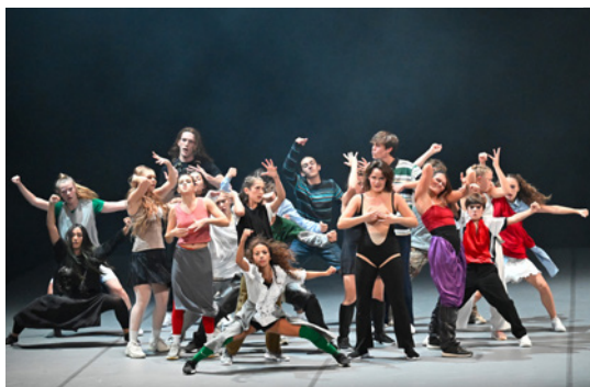
Room with a view par la compagnie Grenade