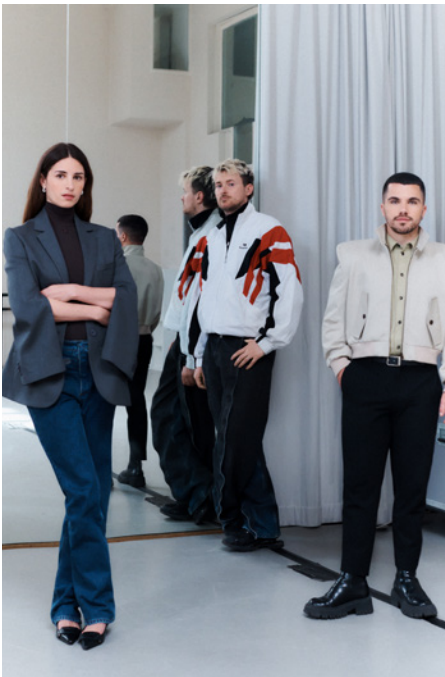
Portrait La Horde