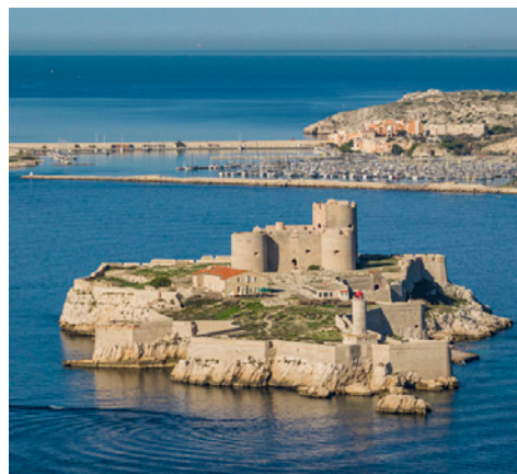
Château d'If

En 1516, François Ier, roi de France, s'arrête à Marseille après la victoire de Marignan. De l'île d'If, il peut étudier les défenses de la ville pour constater que rien ne la protège contre les invasions. Il ordonne alors la construction d'une forteresse sur l'île. Ce n'est qu'en 1524, après une attaque de Charles Quint, que les premiers murs du château sont construits pour pouvoir enfin protéger l'accès du port de Marseille.