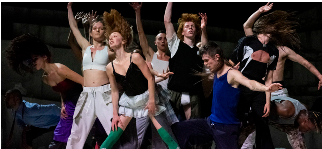
Room With a View © Aude Arago