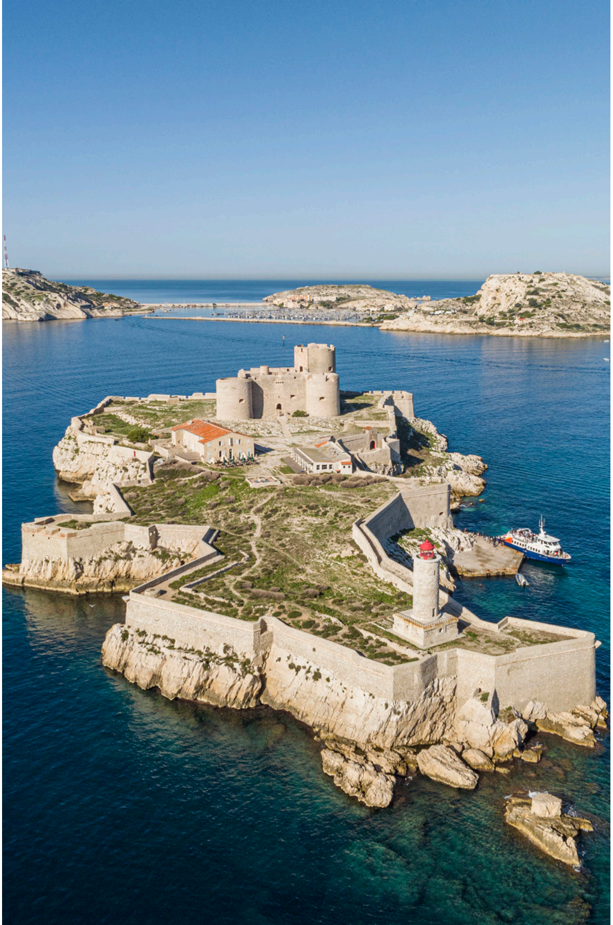
L'île d'If