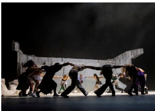
Room With a View par le Ballet National de Marseille