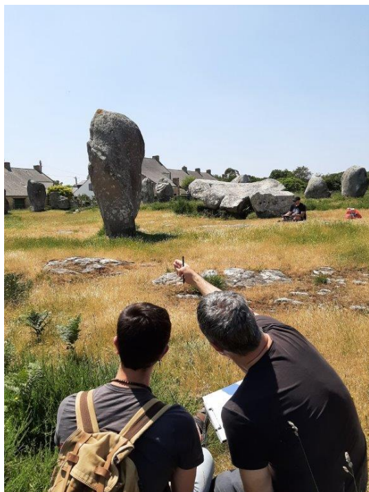
Printemps du dessin 2023 aux alignements de Carnac