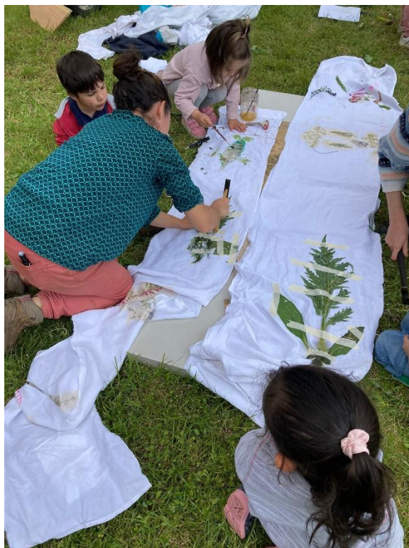
Printemps du dessin 2023 au château d'Assier