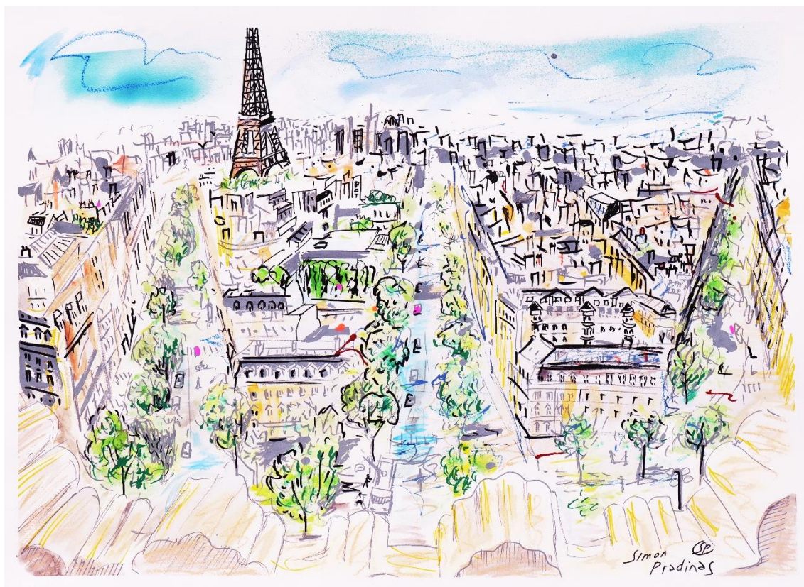
Printemps du dessin 2023 à l'Arc de triomphe © Simon Pradinas