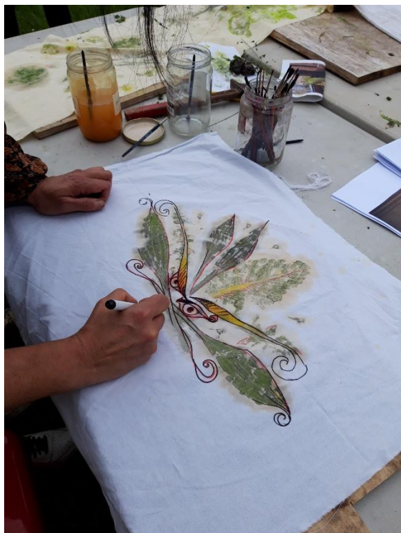
Printemps du dessin 2023 au château d'Assier