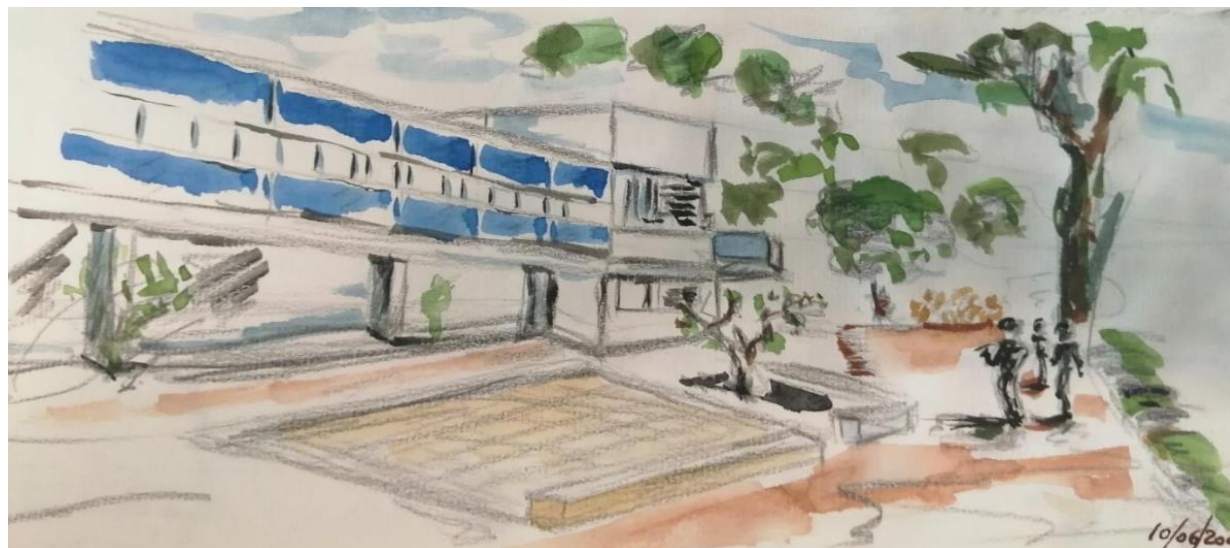
Printemps du dessin 2023 à Cap Moderne