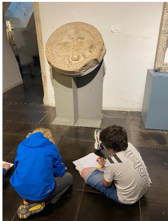
Printemps du dessin 2023 à l'abbaye de Cluny