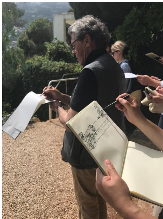
Printemps du dessin 2023 à Cap Moderne