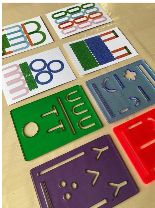
Printemps du dessin 2023 aux tours de la cathédrale d'Amiens