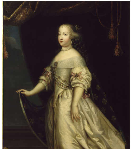
Marie-Thérèse d'Autriche, reine de France