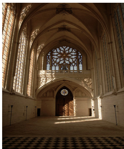
La Sainte-Chapelle

La Sainte-Chapelle, dont la construction débuta vers 1390, fut inaugurée en 1552. Elle était destinée à abriter une partie des reliques du Christ. Témoignant de la transition entre le gothique rayonnant et le gothique flamboyant, elle se compose d'un vaisseau unique, d'un chœur et d'une abside. Ses vitraux ont été conçus par Nicolas Beaurain.