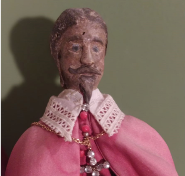
Le Cardinal