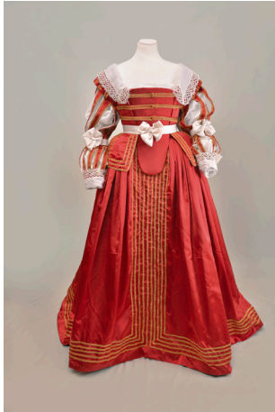
Robe 17 ème rouge et or