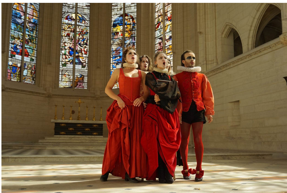
Compagnie Mystère Bouffe dans la Sainte-Chapelle du château de Vincennes

Réservation en ligne sur www.chateau-de-vincennes.fr