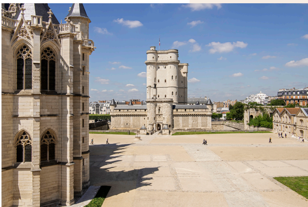
Donjon du château de Vincennes vu depuis la tour des Salves

En se connectant sur www.mapierrealedifice.fr , les amoureux du patrimoine peuvent faire un don pour le château de Vincennes (« Mon monument préféré ») et ainsi contribuer à l'animer, l'entretenir et le préserver.