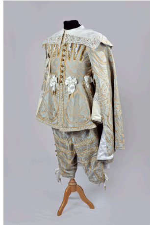
Costume époque Louis XIII