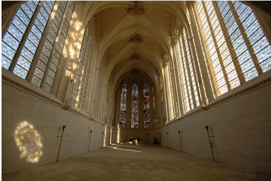
La Sainte-Chapelle de Vincennes