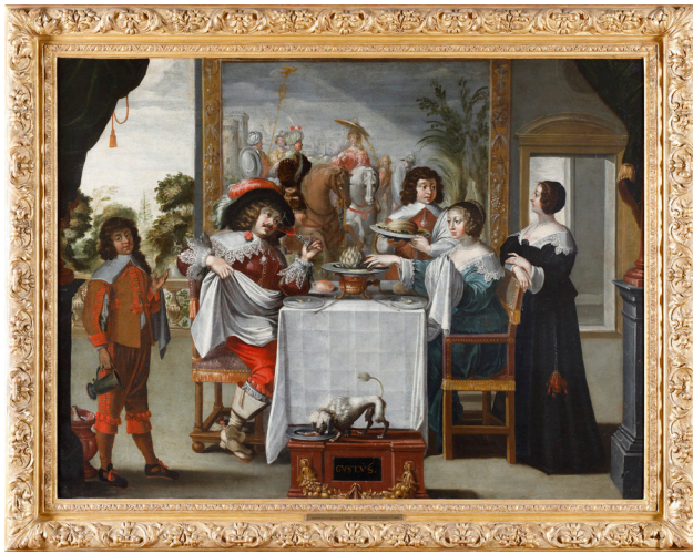
Abraham Bosse, Le Goût