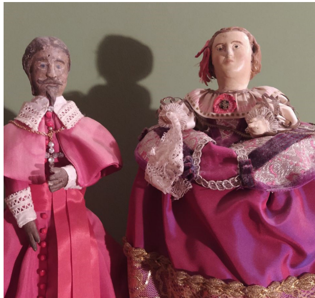
Le Cardinal et l'Infante