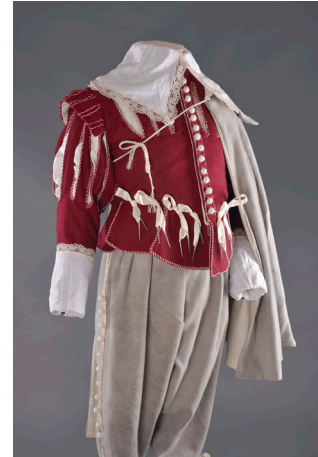
Homme 17 ème siècle © Patrick DALLANEGRA.