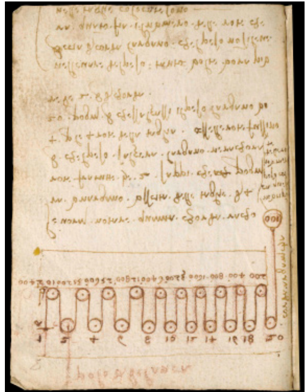
Léonard de Vinci Codex Forster III Milan, vers 1490-1493 Plume, encre et craie rouge sur papier, relié en parchemin Fermé : 9,3 x 7 cm Victoria and Albert Museum, MSL/1876/Forster/141/III Legs de John Forster