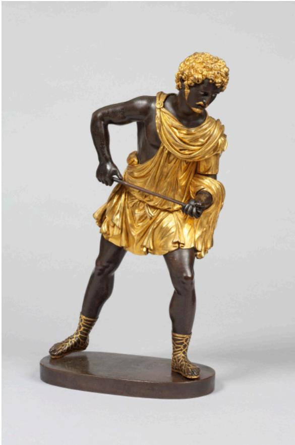
L'Antico (Pier Jacopo Alari Bonacolsi, dit) Méléagre