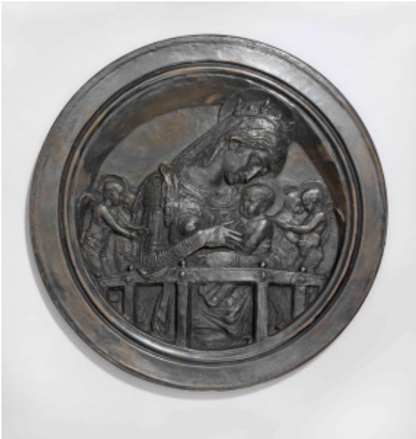
Donatello (Donato di Niccolò di Betto Bardi, dit) Madone Chellini Padoue (?), vers 1450 Bronze partiellement doré Diam. 28,5 cm Victoria and Albert Museum, A.1-1976