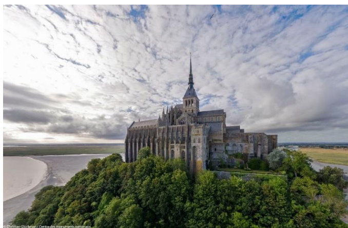
L'abbaye du Mont-Saint-Michel