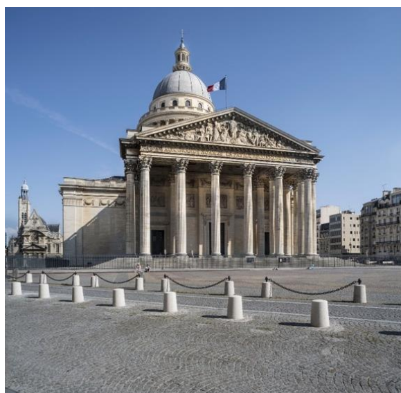
Panthéon, façade occidentale