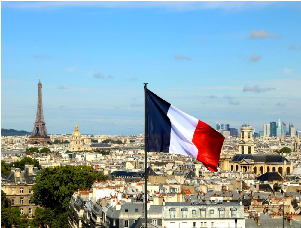
Panorama du Panthéon

Une vue exceptionnelle sur la capitale est à découvrir du 1 er avril au 31 octobre 2023 à l'occasion de la réouverture du panorama du Panthéon