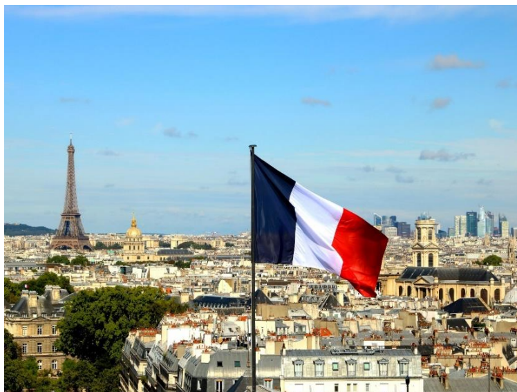
Panorama du Panthéon