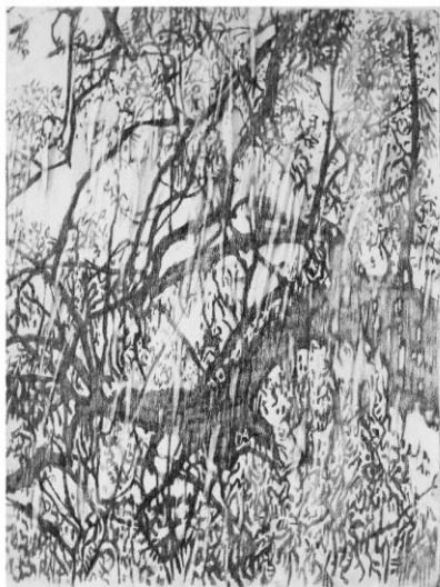
On ne possède éternellement que ce que l'on a perdu.

Mine de plomb et graphite sur papier marouflé sur toile - 200 x 200 cm – crédit : François Réau