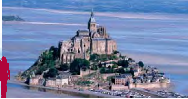
Vista aérea del Mont-Saint-Michel