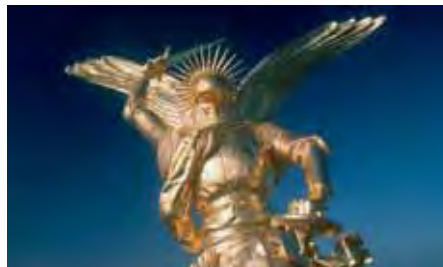
El arcángel Saint-Michel