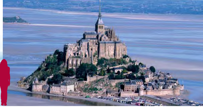
Die Abtei von Mont-Saint-Michel