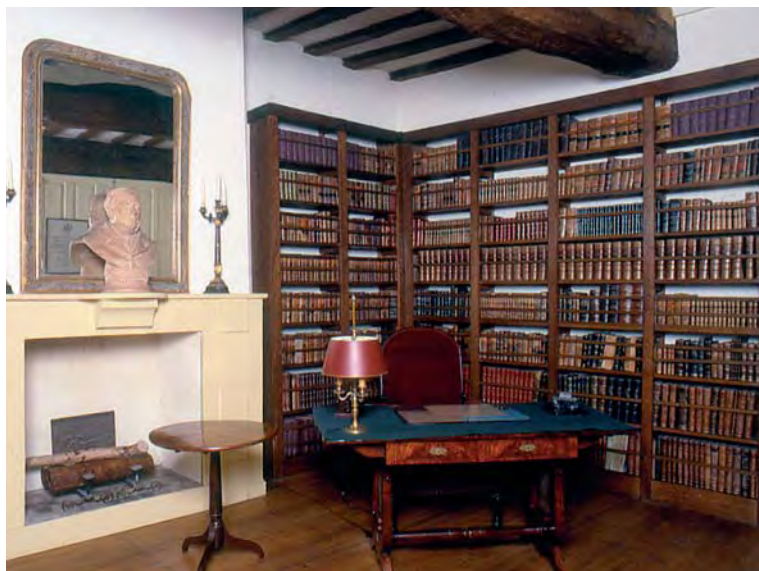
Maison d'Ernest Renan

> Gratuité jusqu'à 17 ans inclus (hors groupes scolaires et péri-scolaires)