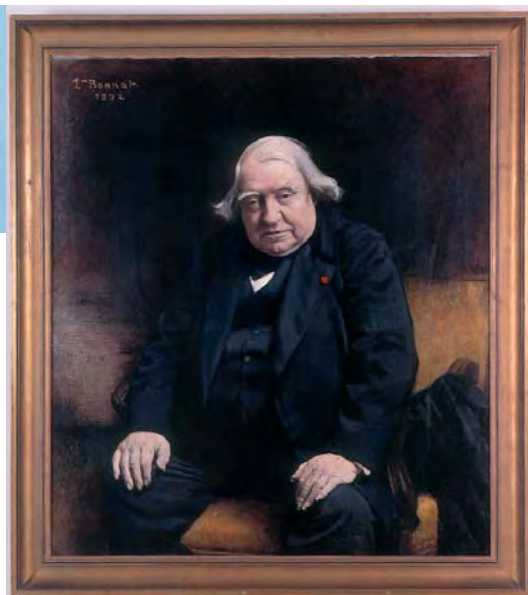
Maison d'Ernest Renan - Détail