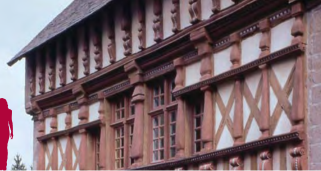
Maison d'Ernest Renan