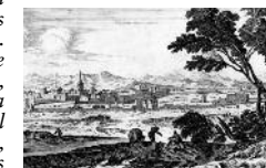
Fréjus a principios del siglo XVIII. Grabado de Mariette, Biblioteca nacional de Francia, Grabados

Prueba de la existencia de una comunidad cristiana en Fréjus es que al obispo de dicha localidad lo mencionan por primera vez durante el Concilio de Valencia del año 374. El baptisterio, todavía hoy en pie, y la primera catedral fueron erigidos a principios del siglo V. Tras atravesar un periodo sombrío y el paso de los piratas sarracenos, la ciudad renace a principios del siglo XI gracias al obispo Riculphe. Entre los siglos XI y XIV se edifican construcciones canónicas alrededor de la catedral para dar cabida al colegio de canónigos*.