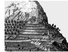
Gravure uit de XVIIde eeuw

Het observanten* franciscanenklooster* werd in 1633 gesticht. In de daarop volgende jaren stelt de gemeente Saorge de Saint Bernard kapel buiten het dorp, en later ook de aangrenzende grond voor de bouw van een klooster*, ter beschikking aan de gemeenschap. Er wordt financiële hulp toegekend voor het afwerken van de kerk. De bouw van de kloostergebouwen* is rond 1662 klaar.