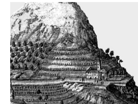
Stich aus dem 17. Jahrhundert

Der Konvent* der Franziskaner-Rekollekten* wurde 1633 gegründet. In den darauf folgenden