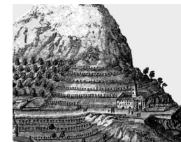
Grabado del s. XVII

El convento* de los Franciscanos Recoletos* fue fundado en 1633. En los años siguientes, el municipio de Saorge puso a disposición de la comunidad la capilla de Saint-Bernard, alejada del pueblo, y más tarde unos terrenos adyacentes para que pudieran construirse un convento*. Por último, les concedió una ayuda económica para que terminaran la iglesia. La construcción de los edificios conventuales finalizó hacia 1662.