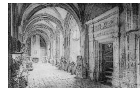
Der Kreuzgang, Zeichnung aus dem 19. Jh.

Ab dem Frühmittelalter war der Kreuzgang der Wirkungsort der Kanoniker der Kathedrale Saint-Gatien von Tours. Die derzeitigen Gebäude