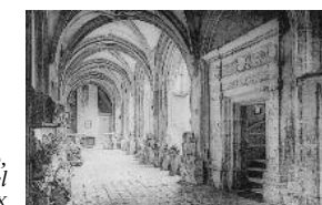
El claustro, dibujo del siglo XIX

Desde la Alta Edad Media, el claustro es el lugar de trabajo de los canónigos de la catedral de