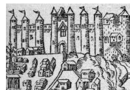
十六世纪的雕刻作品。

十六世纪末，宗教战争频繁，国王亨利三世（1574-1589）**命堡垒总督杜纳迪厄·德·普伊沙西克（Donadieu de Puycharic）铲平城楼的顶部和城墙，以适应火炮技术的发展（安置大炮），加强堡垒的防御性。此后，昂热城堡便逐渐没落，仅沦为一般的庇护堡垒，几度被用作牢房关押犯人。