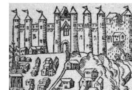
Gravure uit de XVIde eeuw.