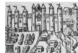
Stich aus dem 16. Jh.

Am Ende des 16. Jh. inmitten der Religionskriege ließ der Befehlshaber der Festung, Donadieu de Puycharic, auf Befehl von König Heinrich III. (1574-1589)** die Dächer der Türme und die Festungsmauern abtragen. So passte er die Festung an die Fortschritte der Artillerie an. In der Folge war sie nur noch eine einfache Wehranlage, die mehrfach als Gefängnis diente.