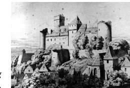
Die Burg im 19. Jh.

Die Burg Castelnau-Bretenoux wurde im 13. Jh. von den seit langem im Haut-Quercy angesiedelten Baronen von Castelnau de Bretenoux erbaut.