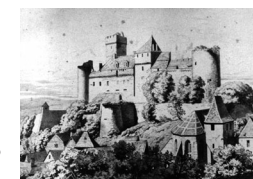
El castillo en el s. XIX.

El castillo de Castelnau-Bretenoux empezó a construirse a partir del s. XIII por encargo de los barones de Castelnau de Bretenoux, que llevaban