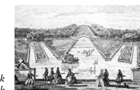
Der Park im 18. Jh