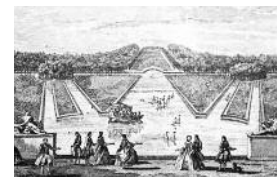
El parque en el siglo XVIII.