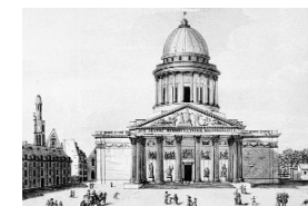
Вид в конце XVIII века

В 1744 г., после болезни, исцеление от которой он приписывал мольбам святой, Людовик XV принял обет воздвигнуть в честь Женеьевы