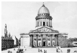
Afbeelding uit het einde van de XVIII eeuw

In 1744, na een ernstige ziekte waarvan hij de genezing toedicht aan het aanroepen van de heilige, legt Lodewijk XV de gelofte