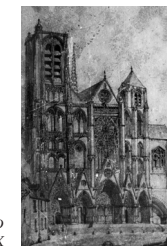
Grabado del s. XIX

La construcción de la catedral de Saint-Étienne comenzó en 1195, impulsada por Henry de Sully, arzobispo de Bourges. En 1215 ya estaban terminados la cabecera, el coro y la doble girola*. La nave y la fachada se realizaron entre 1225 y 1255, y la consagración de la catedral tuvo lugar en 1324.