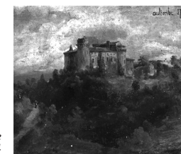
Aulteribe in 1794

Het kasteel van Aulteribe werd in de tweede helft van de XIVde eeuw gebouwd. Het wordt rond 1450 eigendom van de heren van La Fayette en vervolgens van de