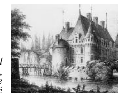
Het kasteel rond 1820, litbografie van Langlumé

De nakomelingen van Antoine Raffin wonen tot de XVIIIde eeuw in het kasteel. In 1791 koopt markies Charles de Biencourt het domein. Deze aristocraat en zijn nakomelingen herstellen het kasteel in de glorieuze staat van weleer en leggen het grote romantische park aan. De geruïneerde laatste markies moet het domein aan het eind van de XIXde eeuw verkopen. De staat koopt in 1905 het kasteel en een deel van het park.