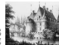
Das Schloss gegen 1820