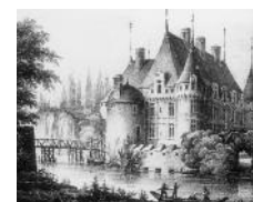
El castillo hacia 1820, litografía de Langlumé.

Los descendientes de Antoine Raffin vivieron en el castillo hasta el s. XVIII. En 1791, adquirió la propiedad el marqués Charles de Biencourt. Este aristócrata y sus descendientes devolvieron al castillo todo su esplendor. Crearon el gran parque romántico. El último marqués se arruinó y tuvo que vender la finca a finales del s. XIX. El Estado compró el castillo y parte del parque en 1905.