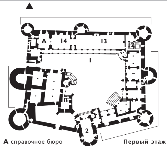
А справочное бюро